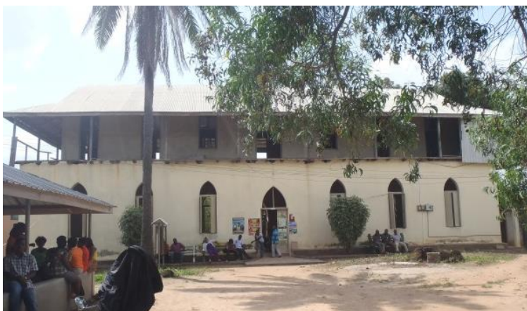
Ehemalige deutsche Missionskirche der Basler Mission in Ho, Volta Region, Ghana.

Die Deutsche Kirche, direkt am Missionsgebäude der Bremer Mission, wird auch aktuell noch für Gottesdienste genutzt. Das obere Stockwerk ist jedoch baufällig. Das Gebäude soll jetzt renoviert und überwiegend Schulkindern zur Verfügung gestellt werden.