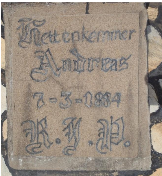
Auch die weiteren Grabsteine weisen keine Geburtsdaten auf. Hier beerdigt: Andreas Kettenkemmer.