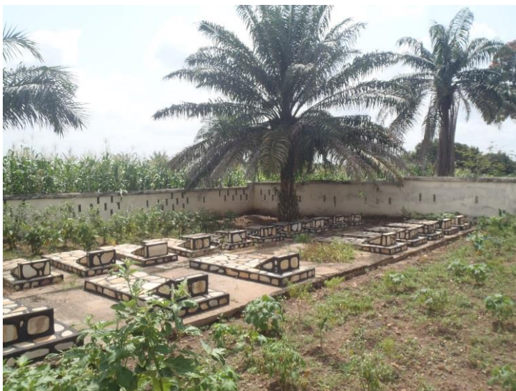
Hinter dem Missionsgebäude gelegen: Friedhof der Bremer Mission in Ho, Volta Region, Ghana | Fotos: Nina Paarmann

Auf dem Friedhof hinter dem Missionsgebäude liegen Pastoren und Pastoren-Gattinnen der Bremer Mission begraben.