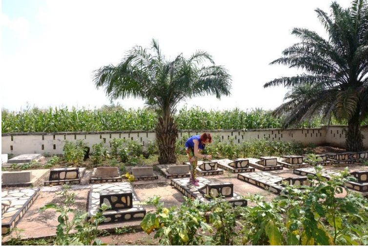
Sicht über die Friedhofsmauern der Bremer Mission in Ho, Volta Region, Ghana