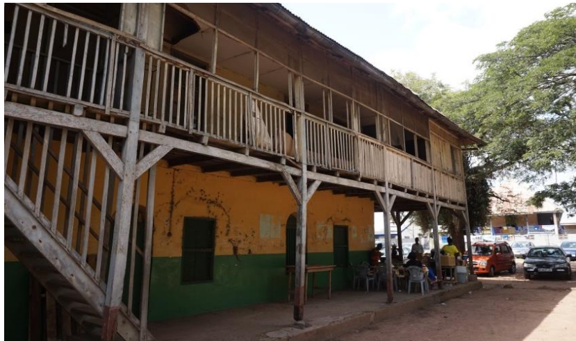
Seitenansicht des Missionsgebäudes der Bremer Mission in Ho.

Die Grundmauern wurden aus Lehm gebaut, mit einzelnen Steinen durchsetzt. Der überwiegende Anteil des verarbeiteten Holzes stammt aus Europa.