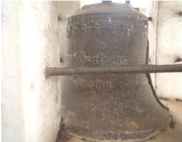
Die Glocke der Bremer Mission in Ho.

einer von insgesamt fünf Kriegen zwischen dem Ashanti-Reich und dem British Empire, zusammengefasst als „Anglo Ashanti Wars“ (1824 – 1901). Nach dem letzten Krieg, dem „Kampf um den Goldenen Stool“, mussten sich die Ashanti 1901 geschlagen geben und wurden Teil des British Empire. Somit wurden sie auch offiziell zu Einwohnern der Goldküste erklärt.