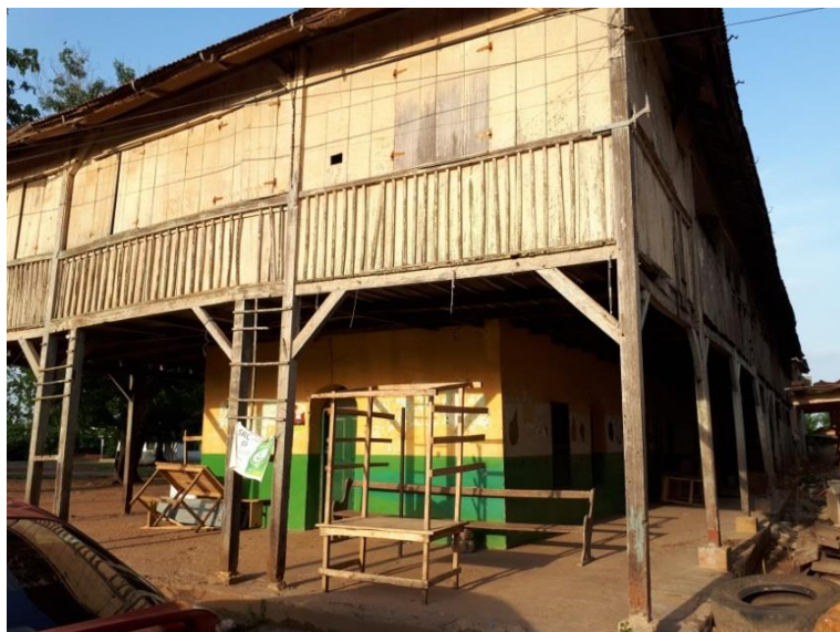
Frontansicht des Missionsgebäudes der Bremer Mission in Ho. | Foto: Nina Paarmann

Es befinden sich aktuell noch etwa 20.000 Gebäude dieses Baustils (süddeutsches Bauernhaus des 19. Jahrhunderts) in den südlichen Gebieten Ghanas und Togos.