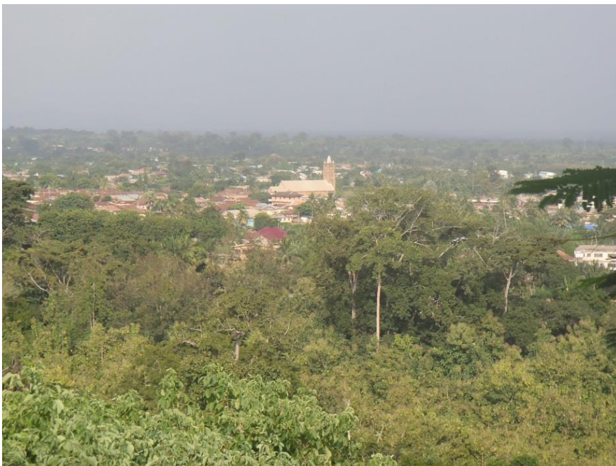
Der Blick hinunter vom Bezirkshauptmanngebäude auf Kpando verdeutlicht die militärisch günstige Lage auf dem Hügel.

Auf einem Hügel nahe Kpando gelegen befindet sich das Verwaltungsgebäude des ehemaligen deutschen Bezirkshauptmannes.