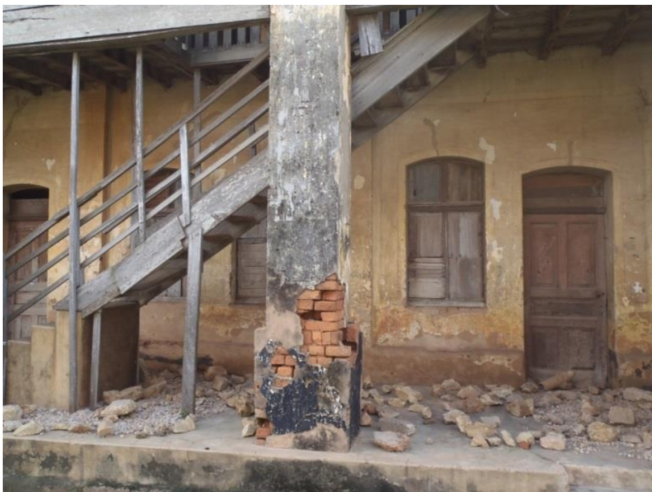
Frontalansicht auf eine der beiden Ruinen.