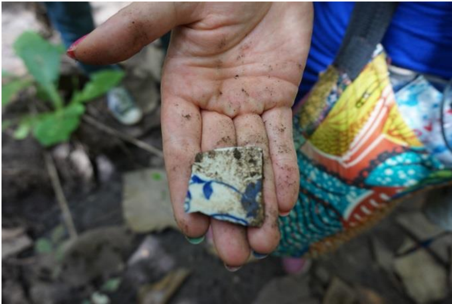
Scherbe eines Porzellantellers aus deutscher Kolonialzeit. Gefunden während der Exkursion nach Ho in einer der Ausgrabungsstätten von Dr. Wazi Apoh.