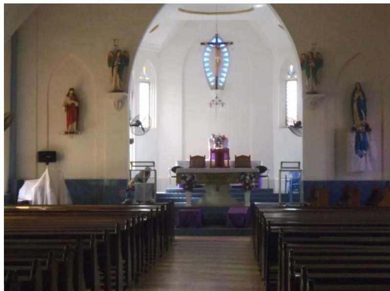
Innenraum der katholischen Kirche aus deutscher Kolonialzeit.