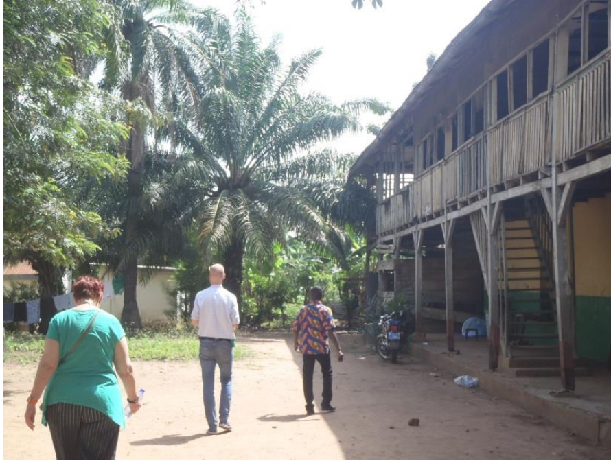
Seitenansicht des Missionsgebäudes der Bremer Mission in Ho.

Seit kurzem ist das Missionshaus im Besitz des ‚Evangelical Presbyterian University College‘ (Ho, Ghana).