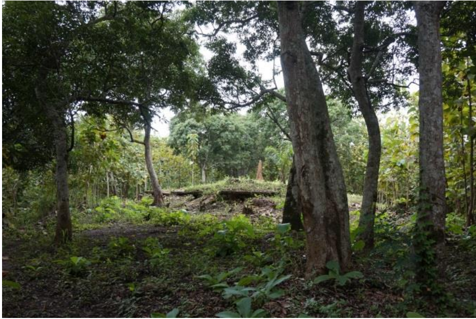
Ein weiteres Fundament eines deutschen Gebäudes auf einem Hochplateau in Ho.

Etwa 30 Autominuten vom Stadtzentrum Hos entfernt befinden sich die Ausgrabungsstätten, die Wazi Apoh im Januar 2016 mit 10 Archäologie-Studierenden seines Seminars eingerichtet hatte.