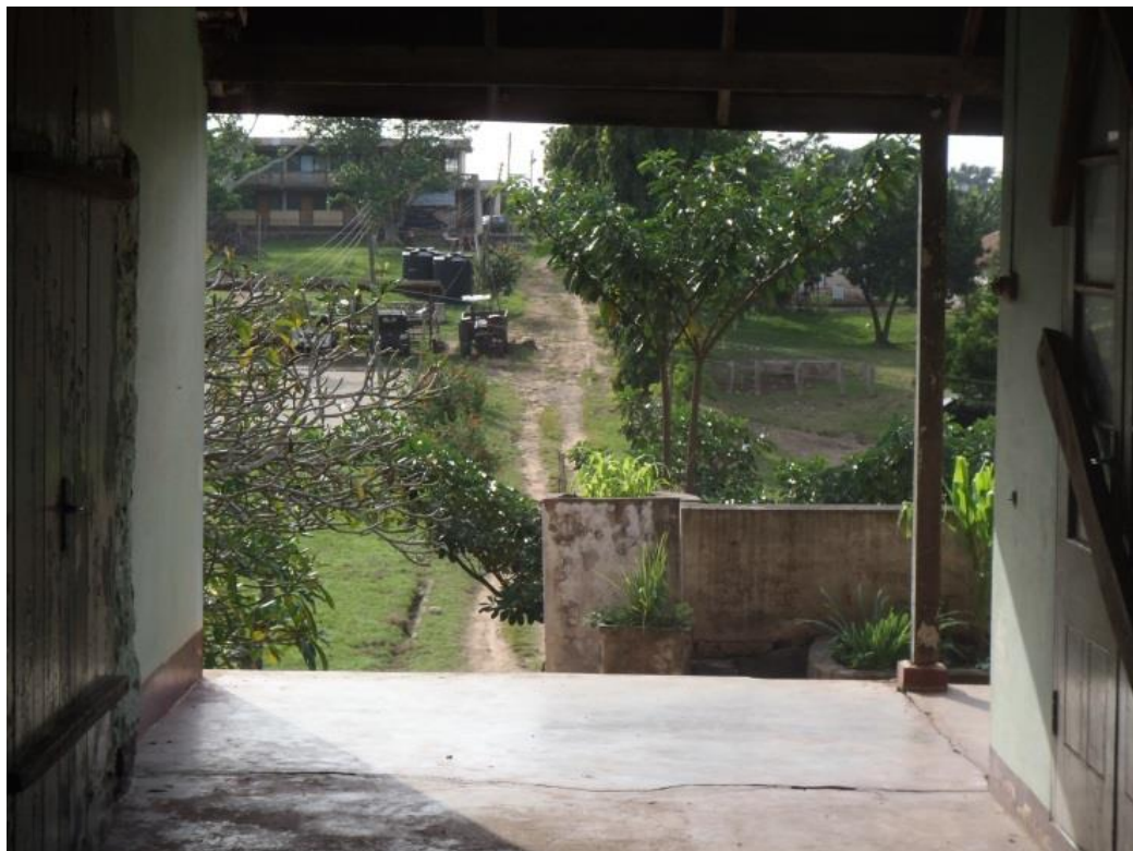
Blick hinunter aus dem deutschen Bezirkshauptmanngebäude in Kpando (auf die Grabungsstätte „Locus B“). Im Hintergrund sieht man die Überreste des ehemaligen „Prison Yards“.