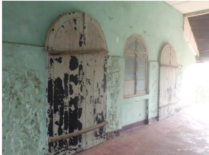
Überreste einer Tür aus dem 19. Jh. im ehemaligen deutschen Bezirkshauptmanngebäude in Kpando („Locus A“)