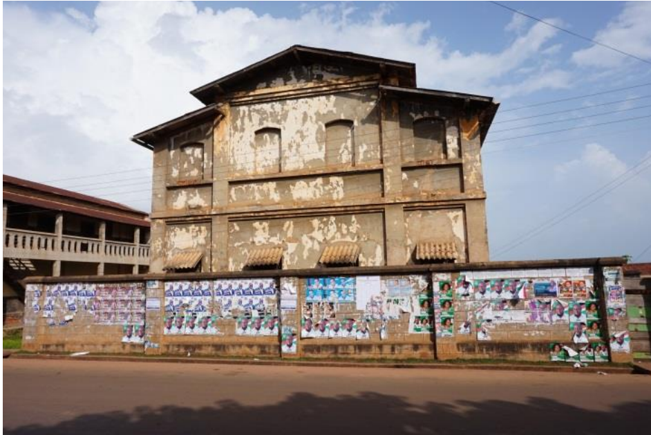
Ehemalige deutsche Missionsschulen in Kpando, erbaut im 19. Jh.

Neben der katholischen Kirche in Kpando befinden sich die Ruinen einer deutschen Missionsschule. Sie wurde ebenfalls im 19. Jahrhundert erbaut. Die Schule war in zwei Gebäudeteilen untergebracht. So konnten Mädchen und Jungen getrennt voneinander unterrichtet werden.