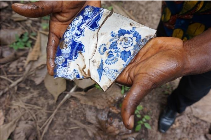
Zusammengesetzt ergeben die einzelnen Scherben einen erkennbaren Porzellanteller aus deutscher Kolonialzeit.