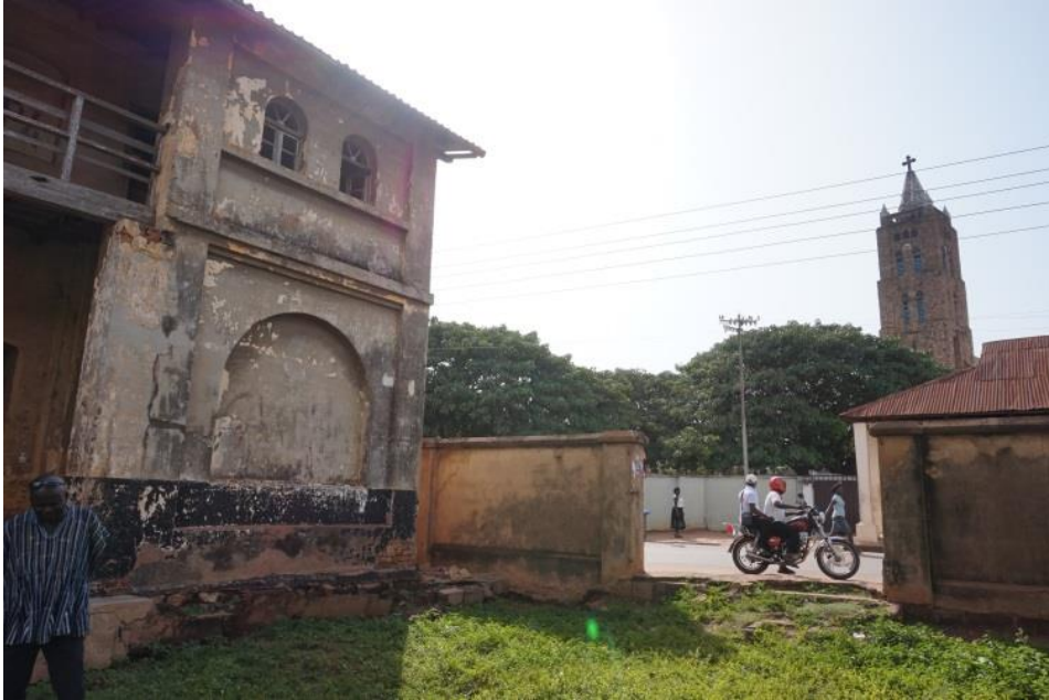
Blick vom Innenhof der Ruinen auf die Kirche aus deutscher Kolonialzeit.