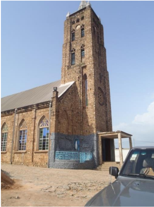
Katholische Kirche im Stadtzentrum Kpandos aus der deutschen Kolonialzeit.

Die katholische Kirche in Kpando wird auch aktuell noch für Gottesdienste genutzt; sie stammt aus der Zeit um etwa 1900.